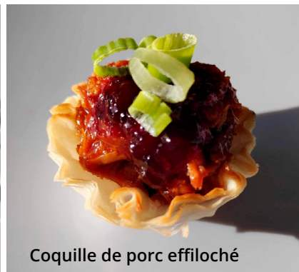
Coquille de porc effiloché