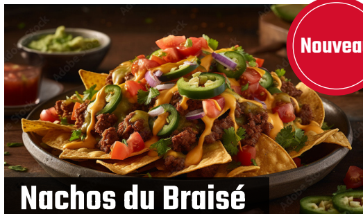
Nachos du Braisé