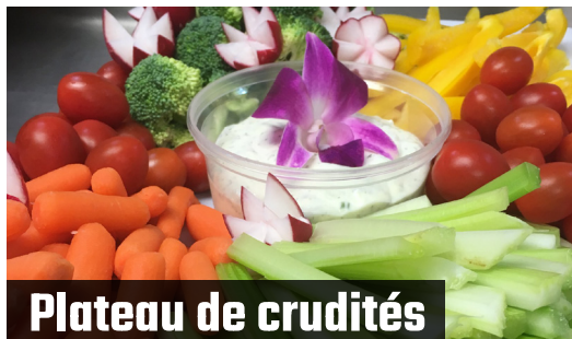
Plateau de crudités