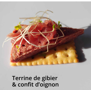
Terrine de gibier & confit d'oignon