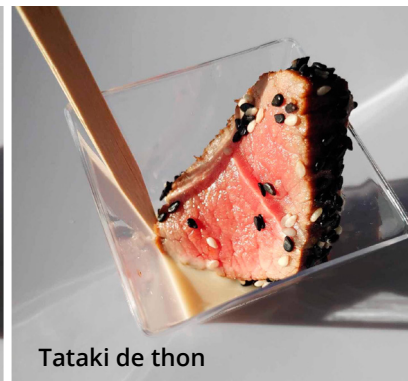
Tataki de thon